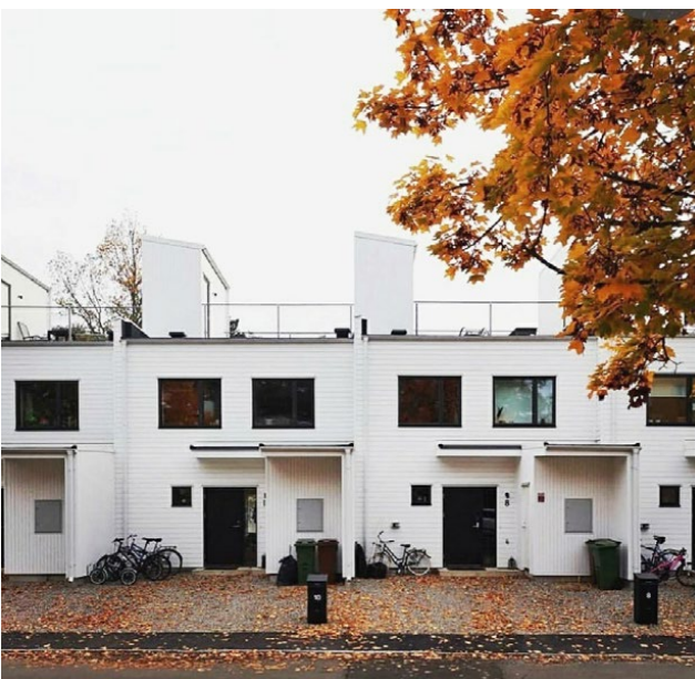
Park9, Västerås, Anders Holmberg Arkitekter AB, 2017

Genom att bygga i egen regi har förståelsen kring förutsättningarna att bygga bostäder ökat, vilket gett mig en mer ödmjuk attityd till själva byggandet. I den vanliga arkitektrollen finns det alltid någon annan man kan ägna sig att vara sur på, nu får jag se mer till mig själv och min egen förmåga.