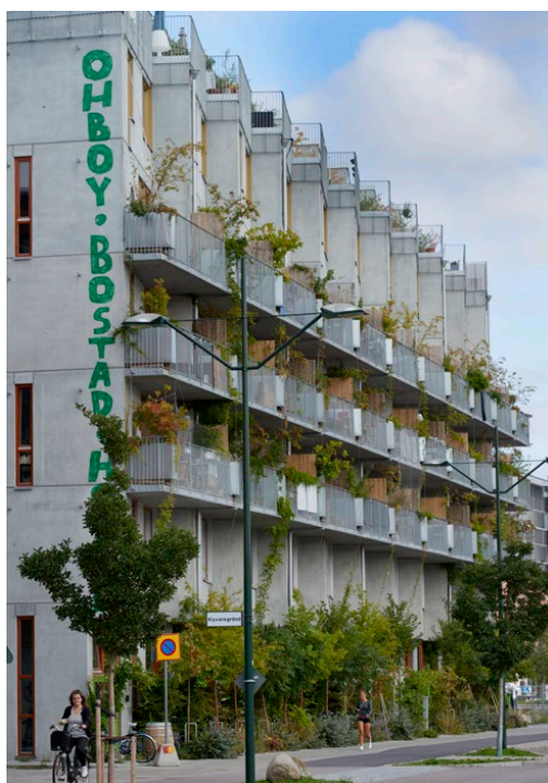
Ohboy, Cykelhuset, Hauschild + Siegel Architecture AB, 2017

Jag har valt att ta ett helhetsgrepp på bostadsbyggandet. Jag vill ge varje nytt projekt en tydlig karaktär och jag vill ta ansvar för helheten. Därför både ritas vi, bygger och förvaltar. Vi utvecklar och förfinar projektet under hela processen.