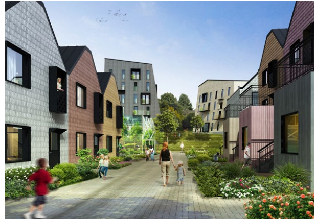
Östra Tomtaklint, Trosa, Larsson Arkitekter i Stockholm AB, pågående

Lis Kjær / Larsson Arkitekter i Stockholm AB