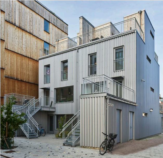
Lilla Integralen, Linköping, sandellsandberg Arkitekter AB, 2018

Finansieringen är såklart huvudfrågan. Men man måste se till att ha rätt människor i projektet, som vet vad de ska göra, det gäller både medarbetare och entreprenörer. Att skapa bra relationer till alla man arbetar med är A och O. En annan viktig aspekt är att ha en rimlig tidplanering, det måste finnas utrymme för omtag, för det kommer alltid bli omtag.