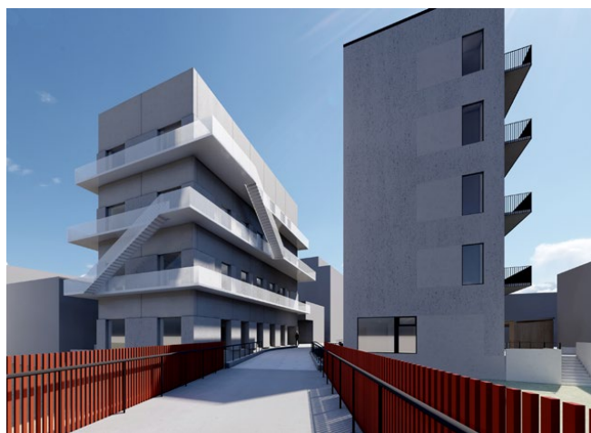
Mostra, Intervall 1, Linköping, Campus Arkitekter AB, pågående