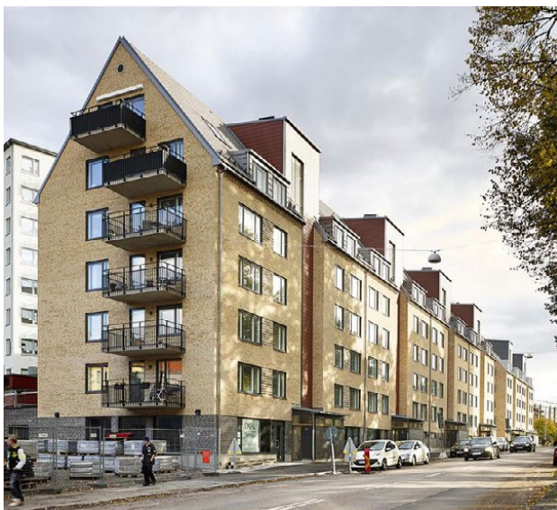
Danska Vägen, Göteborg, Semrén + Månsson Arkitektkontor AB, 2013

Jag drivs av lusten att bygga och kontrollera processen kring detta. Lusten att förändra arkitektrollen dels i den egna verksamheten och dels i ett större perspektiv. Förbättrar bolagets balansräkning vilket också stärker vår roll och agerandet på marknaden.