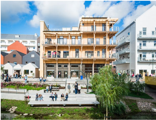
BRF iValla, Linköping, Omniplan AB, 2017

Jag är byggande arkitekt i avsaknad av de byggherrar jag önskar mig. När byggande har blivit en finansiell verksamhet snarare än ett sätt att hantera det egna behovet av bostäder och lokaler tenderar det byggda resultatet att bli mycket sämre än det skulle behöva vara. Min verksamhet fokuserar på att människor och organisationer ska kunna förverkliga sina egna projekt, men ibland tar jag också själv initiativet till projekt som jag tror på.