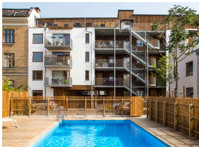
Hamnoasen, Landskrona, Stadstudio AB, 2017