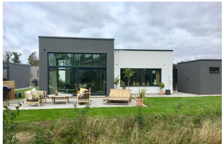
KUNO, Ängelholm, AB Salt Arkitektur, 2019